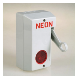
Coupure pompier de sécurité : Boîtier 220v (obligatoire)

Face avant en Plexiglass 3mm blanc diffusant avec une impression numérique quadri haute définition sur adhésif vinyle polymère. Protection de la face avant en polyester anti UV et anti graffiti.