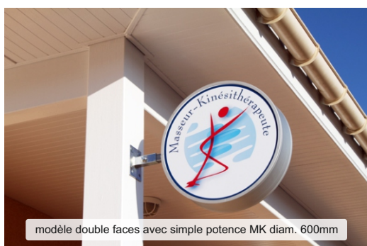
modèle double faces avec simple potence MK diam. 600mm